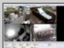
Ansicht über PC