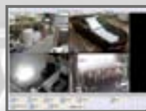
Ansicht über PC