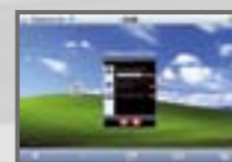
Ansicht Fernwartung PC