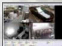
Ansicht über PC